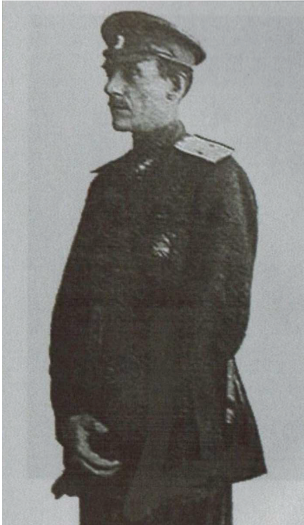
Գեներալ Գաբրիէլ Գրիգորի Ղորղանեան (3 Մայիսի, 1880, Թիֆլիս - 8 Յունուարի, 1954, Փարիզ)