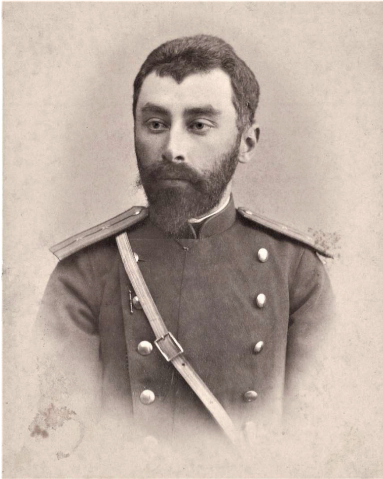
Ստեփան Ղորղանեանը Նախճաւանում աշխատած ժամանակ (1894 թ.)

Խորհրդային աղբիւրները Ստեփան Ղորղանեանի կեանքի վերջին հինգ տարիները ներկայացնում են գրեթէ որպէս «երջանիկ ծերութիւն». որևէ գործունէութեամբ չի զբաղուել, անցել է կենսաթոշակի... Նրա կեանքի այդ հատուածի իրական մանրամասներին մենք տեղեակ չենք, բայց յամենայն դէպս, ենթադրում ենք, թէ ինչ «դրախտային» պայմաններում կ'ապրէր խորհրդային այդ տարիներին նախկին ցարական, իսկ յետոյ դաշնակցական կառավարութեան օրոք գեներալի կոչումով այդ պաշտօնեան: Չնայած իր ազգակից Նիկոլայ Ղորղանեանի ճակատագրի համեմատ՝ դա կարելի է համարել դրախտից էլ վեր մի բան: